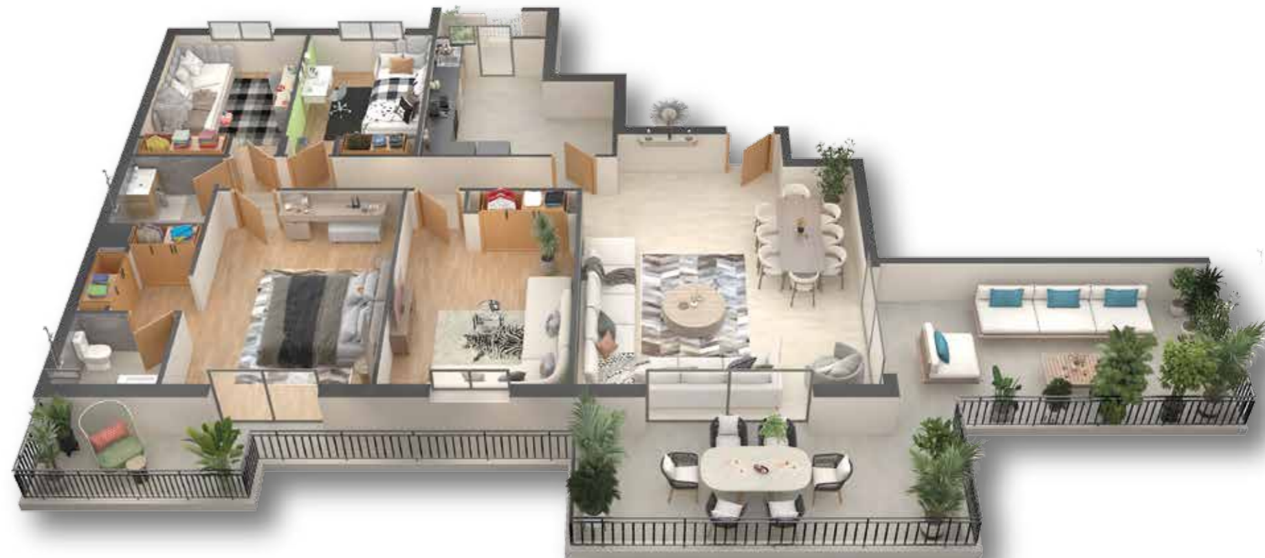
PLAN TYPE F5