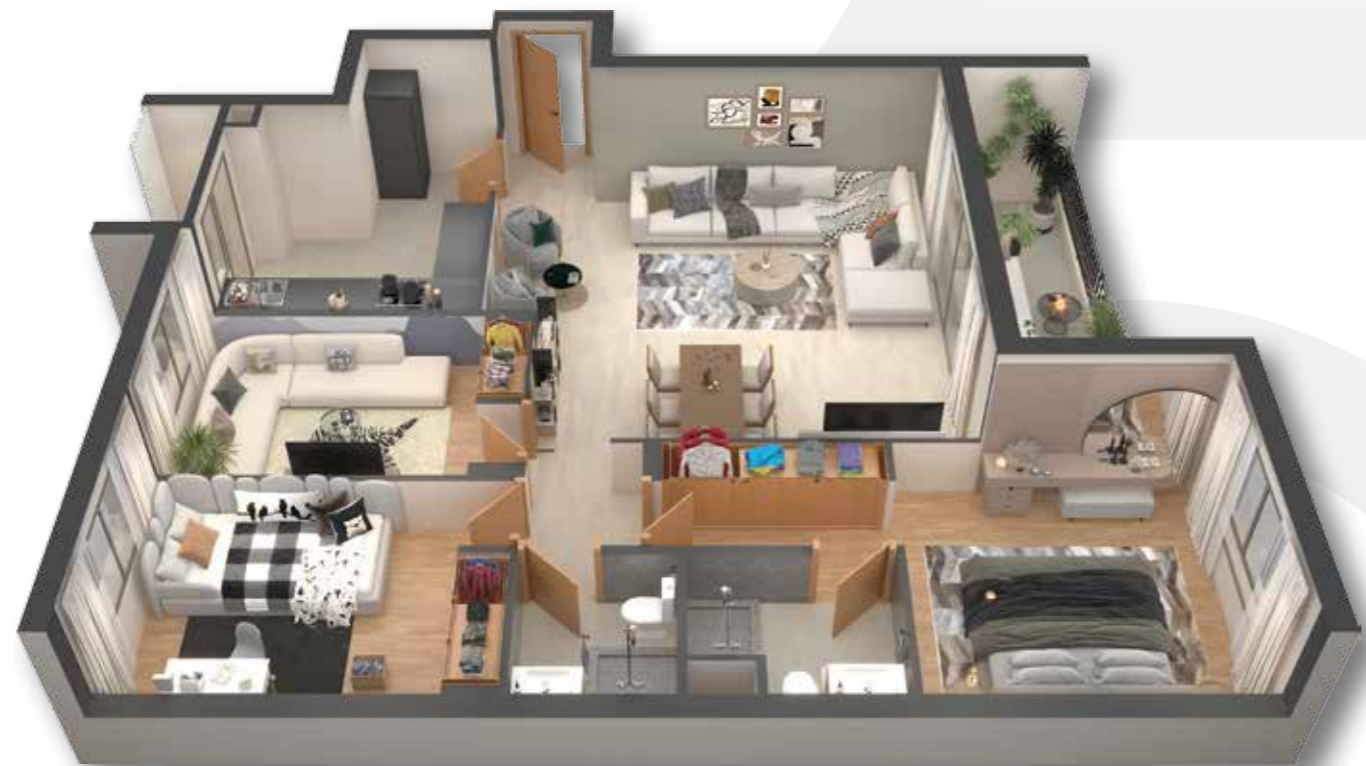
PLAN TYPE F4