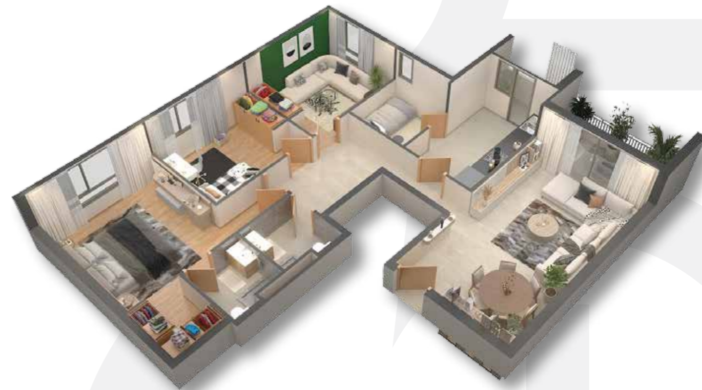
PLAN TYPE F4